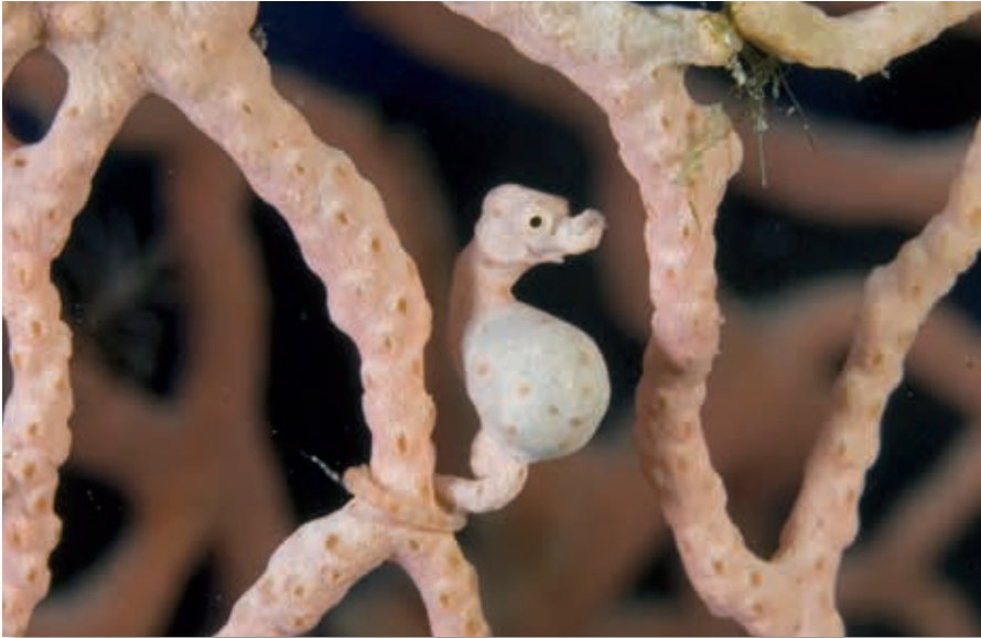
Denise pygmeezeepaardje, Bali

Een wonder als het om het verkleuren van dieren gaat is het kleine pygmeezeepaardje in de gorgonen. Bekend is dat een zeepaardje van een rode naar een gele gorgoon ging en binnen 5 minuten had het diertje de goede kleur aangenomen.