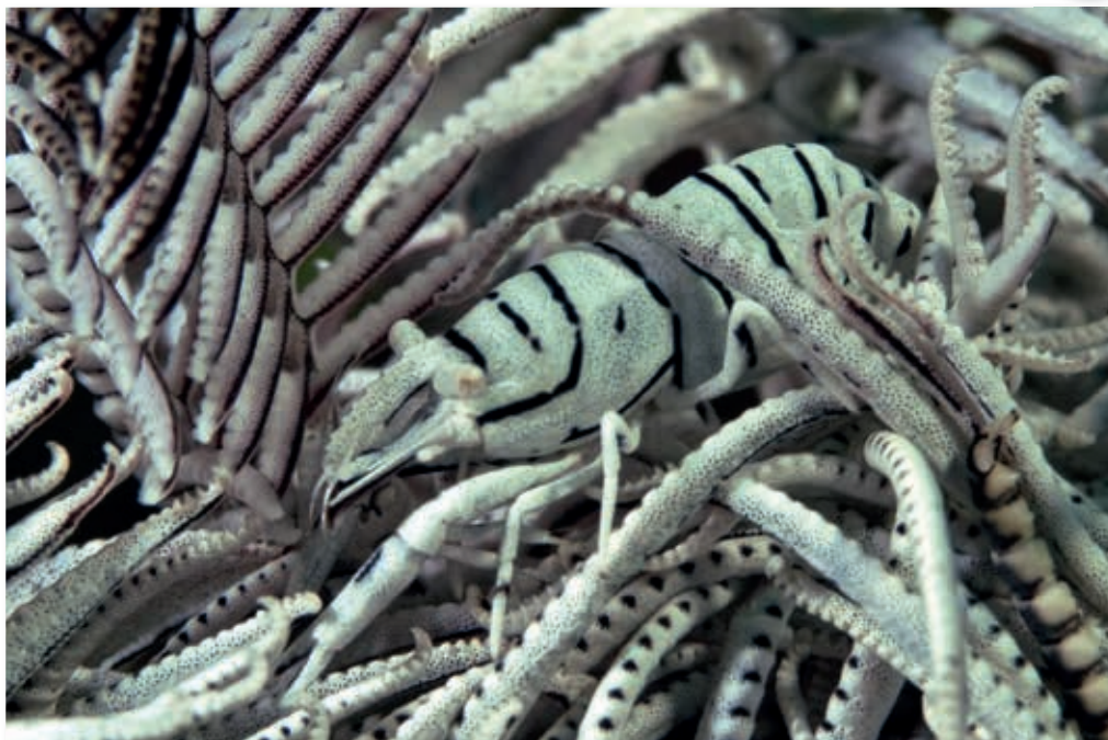
Garnaal in haarster, Sabang

Maar de meest bijzondere octopus is wel de blauwgeringde. Het is maar een klein diertje waar snel overheen wordt