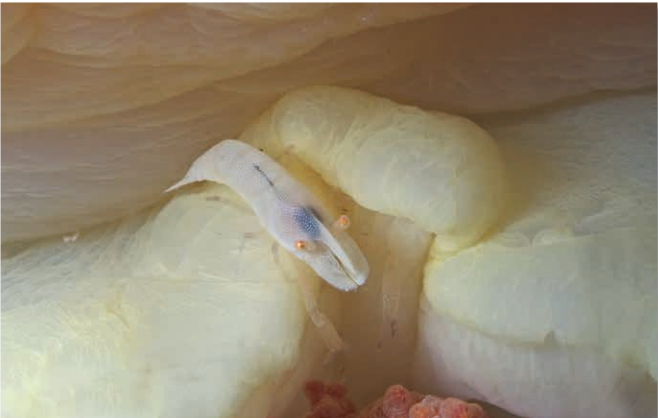
Witte garnaal op witte Spaanse danseres

De cowri heeft een witte schelp, maar de mantel is bedekt met stippen, die weer overeenkomen met de structuur van het lederkoraal. En het kan nog erger. De denise zeepaard van Bali heeft niet alleen de kleur, maar ook de structuur van het gorgoon op zijn lijfje.