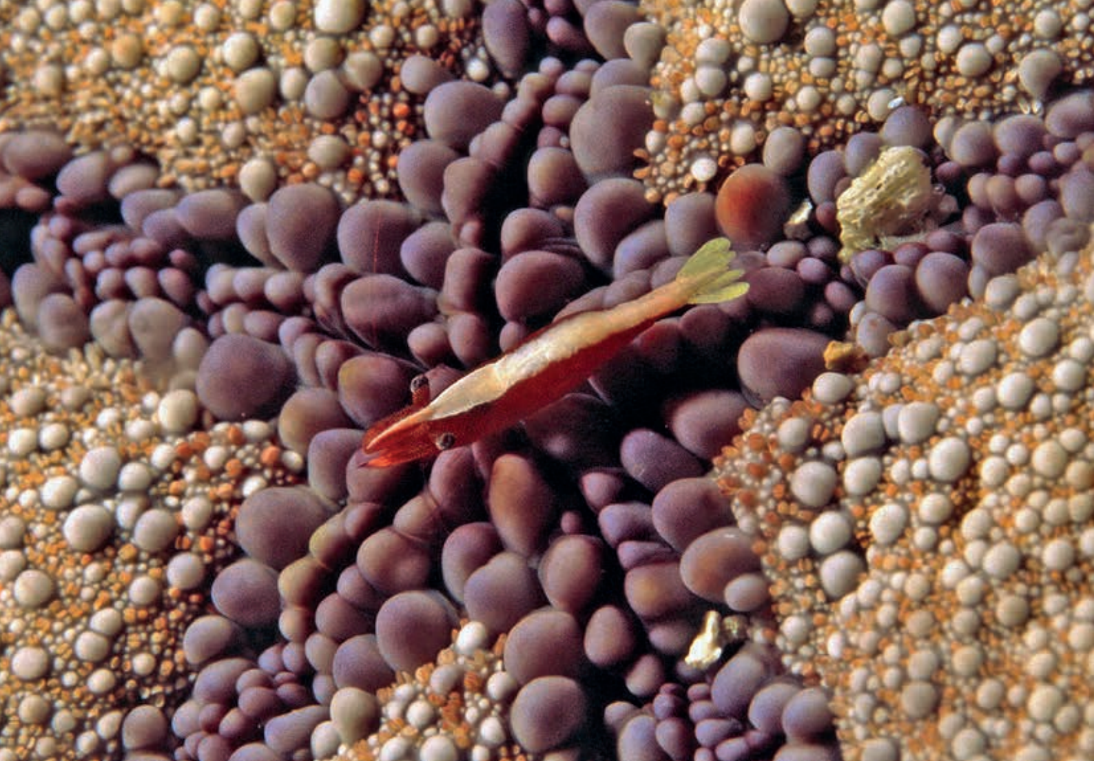
Garnaaltje op zeester

Op de vorige pagina een voorbeeld uit Komodo. Goed te zien dat het visje de kleur en de structuur van het koraal nabootst. De spitssnuitkoraalklimmer is een klein visje met vreemde strepen op zijn lijfje. Eerste indruk: het diertje is wel erg opvallend gekleurd. Pas in het gorgoon, waar ze altijd in wonen, is te zien hoe goed hun kleuren wegvallen in de bizarre structuur van het gorgoon. Op Curaçao is een platvis, voor het gemak Peacock Flounder genaamd, die bijzonder mooi van kleur is. Toch valt hij weinig op. En zodra de lamp is weggehaald, is 'ie nauwelijks nog terug te vinden. De blauwe stippen en strepen vervagen in het blauwe water.