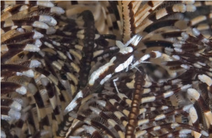
Garnaal in haarster, Negros

Dit pygmeezeepaard is 1 a 2 centimeter groot. Ook de zeegels doen dienst als camouflage. Het beroemde zebrakrabje verdwijnt in de kleurenpracht van de Fire urchin, maar er is ook een kleine garnalensoort, die alleen maar op deze zee-egelsoort voor komt. Ook veel vissoorten blijven heel slim, zolang ze klein zijn, tussen de stekels hangen. En de colemgarnaal is alleen maar op deze vuurzee-egel te vinden. Ze zijn altijd met z'n tweeën, natuurlijk is het grootste garnaltje het vrouwtje. De stippen op hun lijf verdwijnen tussen de bonte kleuren van de stekels. Alleen aan het kale plekje, wat ze weggegeten hebben, is wat te zien, een kleine onregelmatigheid.