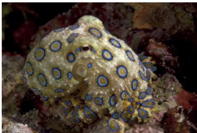
Blauwgeringde octopus, Filippijnen