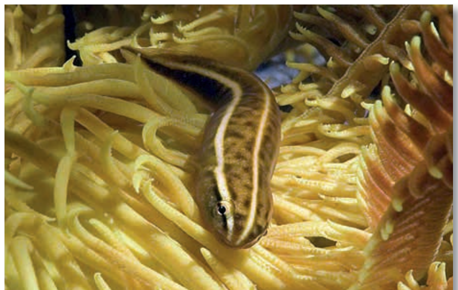
Haarsterzuignapvis, Discotrema crinophila, Sabang

zodra ze bij een zwarte haarster wonen en bijna wit, bij een witte haarster. De groene